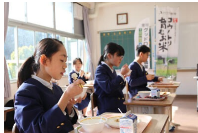
豊岡市/JAたじま より